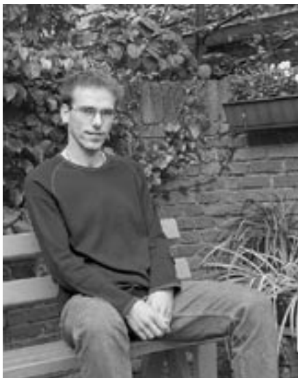
René Hagels