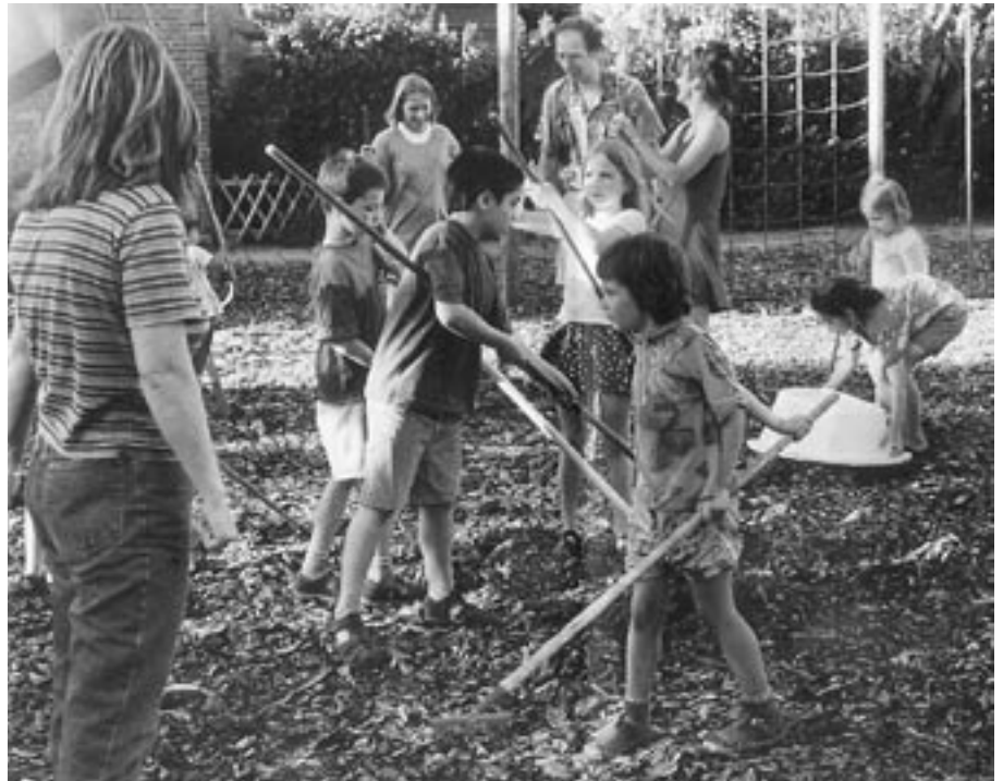
opruimronde op een speelveldje