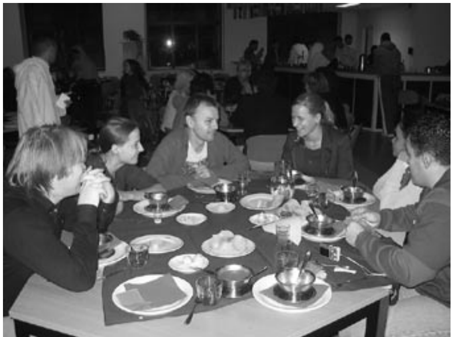
'Lekker eten en een goed gesprek'

Hun belangrijkste doel om de kloof tussen de jongeren en de wijkbewoners te verkleinen is zeker gelukt door de ongedwongen en leuke presentatie. Het eten was lekker en sfeer was goed. Helaas konden de jongeren niet verspreid over alle tafels mee eten, want ze waren druk in de weer met de verzorging van de gasten. Ze hadden niet genoeg tijd om mee te doen aan de tafelsprekken en eventuele individuele kennismaking. Er werd niet alleen veel zoetheid en een Turkse maaltijd genuttigd, maar ook gediscussieerd over