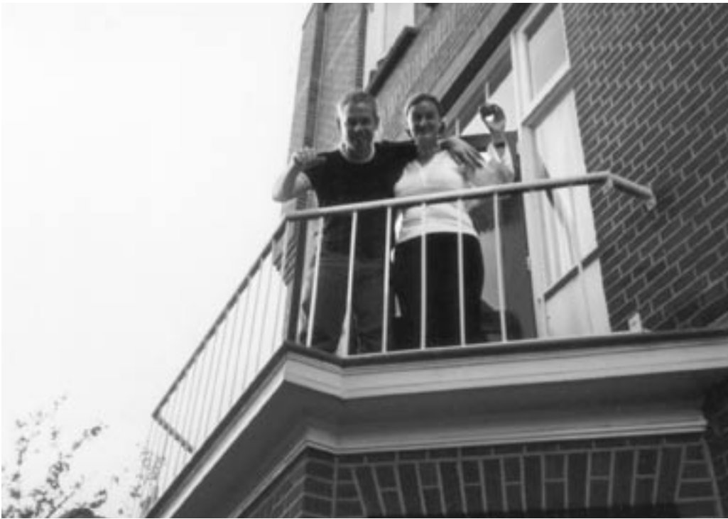
Het huis dat zij verlieten...