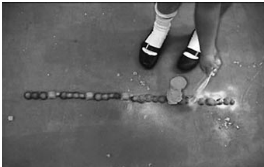
Sung Hwan Kim and a lady from the sea, 'Flat White Rough Cut', deel van een ruimtelijke installatie, video still, 2005.

Hidden Rhythms maakt je op een andere manier bewust van rituelen. Het project van Hilde de Bruijn en het Kunstenaarsinitiatief Paraplufabriek is op zich ook een ritueel, maar zeker niet verborgen: het kunstproject is te zien van 11 december tot en met 22 januari in Museum Het Valkhof en in Paraplufabriek. ■