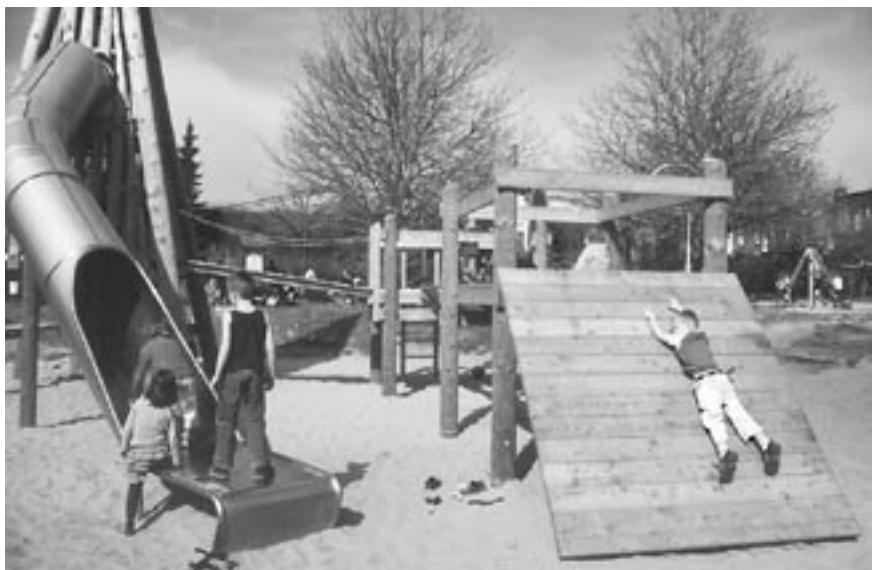
'Alle toestellen voldoen aan de wettelijke eisen'

Andere speeltoestellen zijn onder meer de houten "brug" met een wijde opening over de gehele lengte, een ijzeren klimgordijn met in de top een kraaiennest, een plateau waarop zand omhoog getakeld kan worden en een water/modderbak. De nieuwe apparaten zijn stuk voor stuk mooi en uitdagend. Het is ook fantastisch dat het geld beschikbaar is gekomen om de apparaten aan te schaffen. Maar dat laat de vraag naar