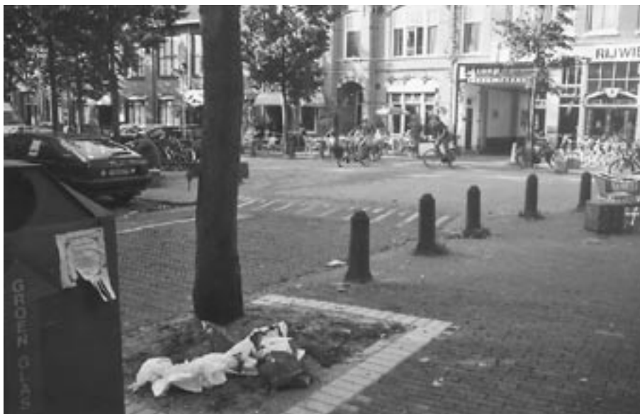
De chaostheorie dichtbij huis

Een voorbeeld dicht bij huis: een kind laat een Marspapiertje op de stoep vallen. Een jongere gooit hier zijn lege bierblikje 'toevallig' naast. Een paar kraaien pikken er even aan, schijten er op. Dit lokt de hond van de burens die er zijn bolus overheen drapeert. Een buurvrouw ziet dit kunstwerkje niet omdat ze met een grote bundel snoeihout loopt; ze glijdt er over