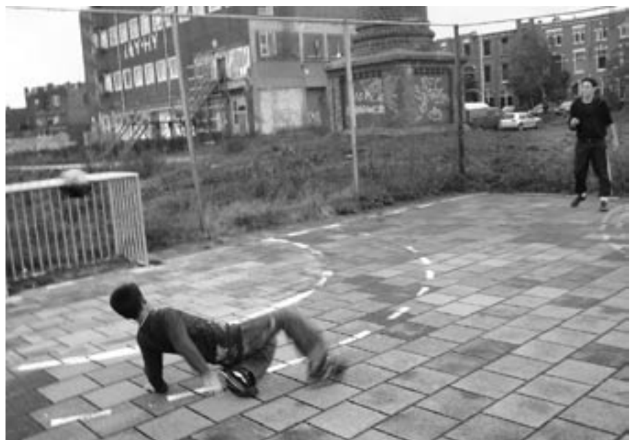
Het speelveld op het Dobbelmanterrein.