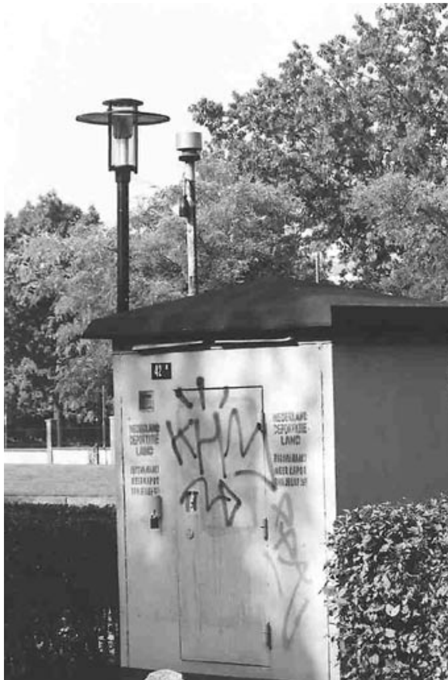
Het meethuisje in het Thiemepark

Het gaat echter allemaal niet snel genoeg, zo vindt niet alleen de Vereniging