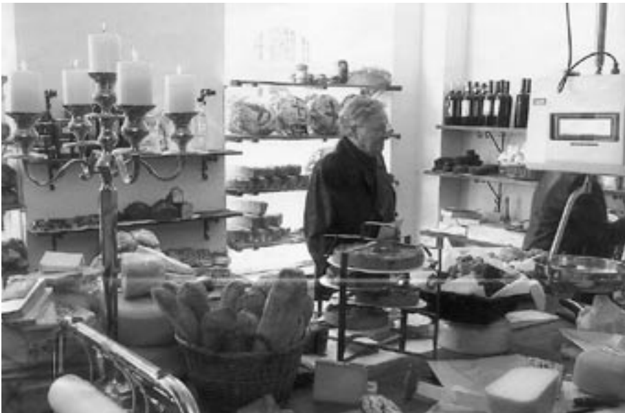
Zo kan het Bakkerscafé op het Dobbelmanterrein eruit gaan zien

te wonen en te werken. Dat is niet alleen belangrijk voor de doelgroep van sociaal zwakkeren, maar ook voor de wijk zelf.'