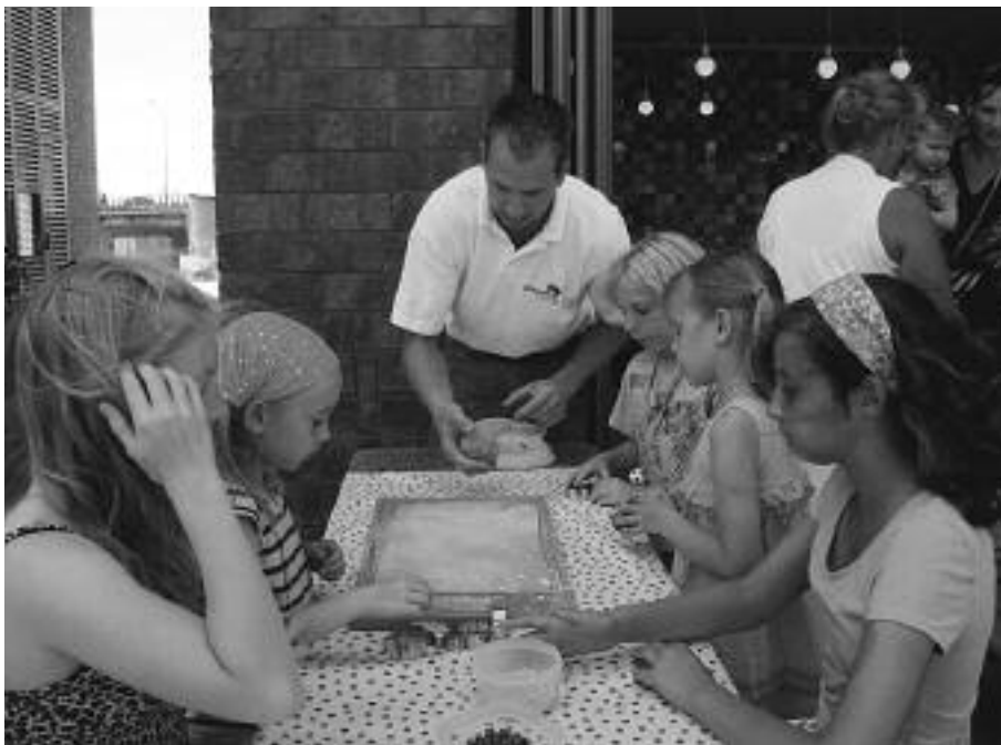
Koekjes bakken bij het bakkerscafé.