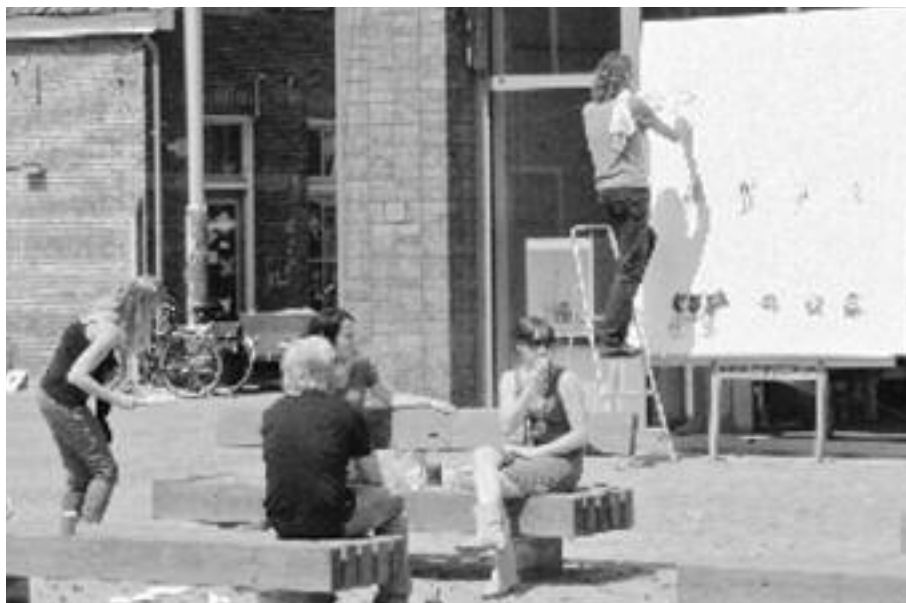
Verrassende kunstwerken ontstaan in het openbaar