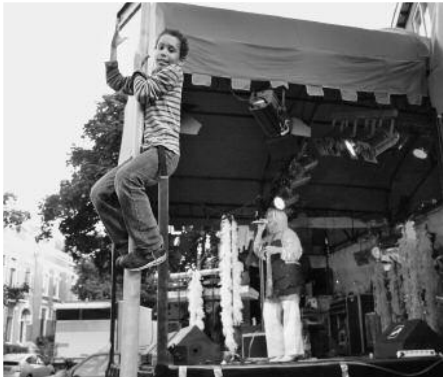
Impressie van 'Bottendaal Alive'

Er is nog geen inhoudelijke reactie gekomen op de brieven die de BOB heeft verstuurd aan de gemeente en aan Talis om opheldering te krijgen over de plannen rondom de Castellatoren (de Talistoren). Er zijn signalen dat de bouw niet doorgaat of op de lange(re) baan geschoven wordt. De gemeente zou tot nader order alle grote projecten stop gezet hebben en binnen Talis is een belangrijke supporter van het project uit de directie vertrokken. Wel is duidelijk dat de bouwvergunning is verlopen. Wat er ook gaat gebeuren, alle procedures zullen opnieuw doorlopen moeten worden. Omdat de Castellatoren altijd integraal onderdeel is ge-