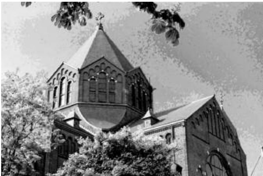
Die goeie ouwe torenspits