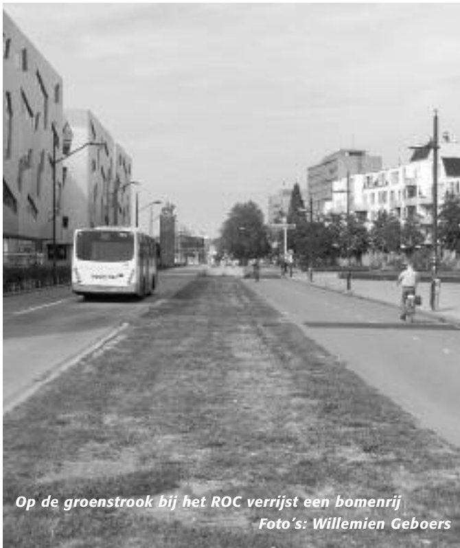
Op de groenstrook bij het ROC verrijst een bomenrij