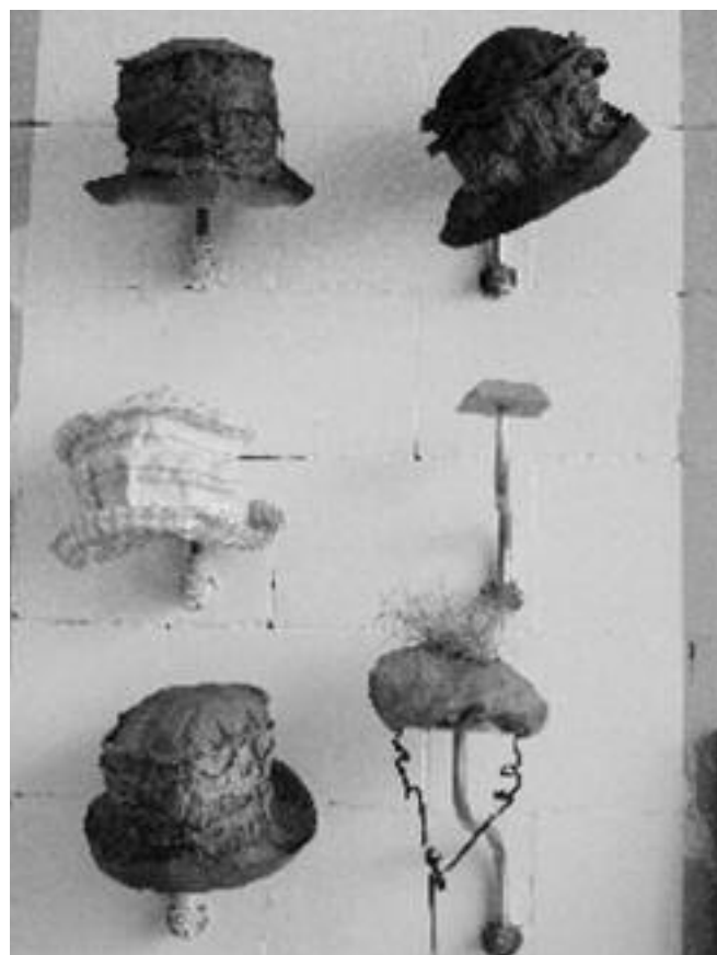
Kunst ontkiemt in de Zeepfabriek

De Zeepfabriek, Dobbelmanterrein, Graafsedwardsstraat 14, Nijmegen http://zeepfabrieknijmegen.blogspot.com /Zeep zaait