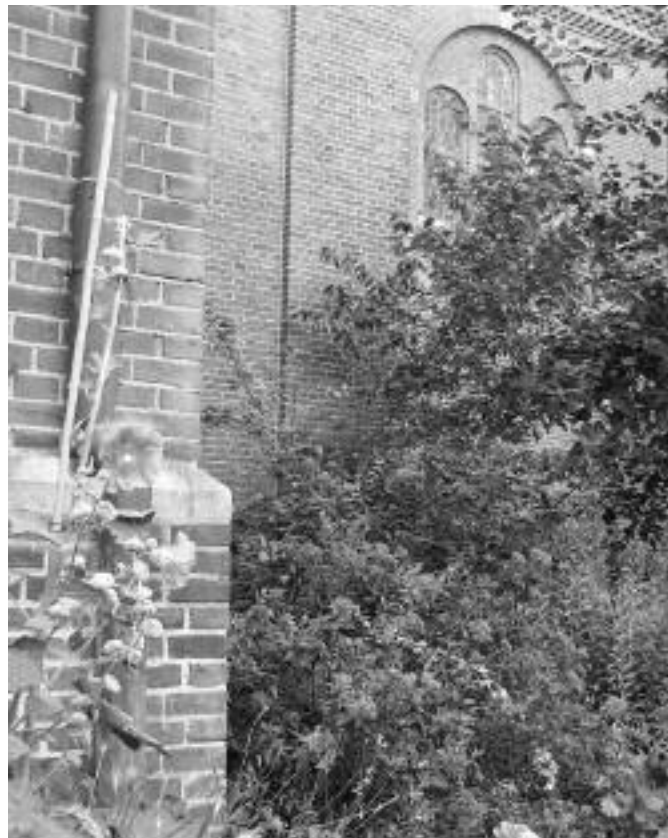
Bij de Titus Brandsmakerk komt een vlindertuin

Zie ook: www.naturama.nl en www.vlinderkas.com