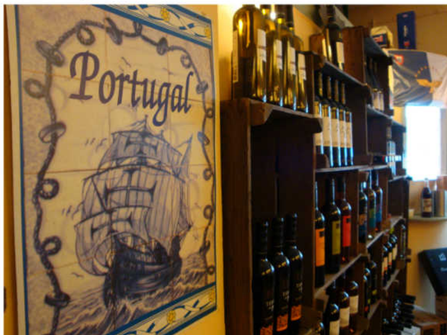
Ook Delicia, neemt ook deel aan de Kunstnacht

In het laatste weekend van september kan men in Nijmegen letterlijk en figuurlijk cultuur proeven tijdens de vierde editie van de Nijmeegse Kunstnacht.