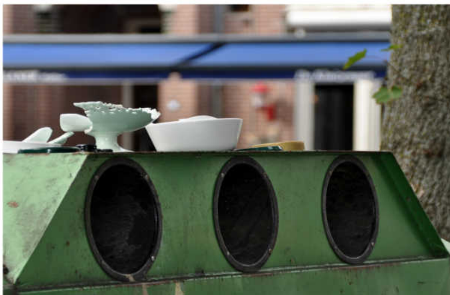
Het resultaat van de afwezigheid van een afvalbak bij de glascontainers bij café Maxim: het restafval wordt boven op de glascontainer verzameld

de openbare ruimte die her en der hangen, zijn veel te klein. Ze maken bovendien geen onderscheid tussen de verschillende soorten afval. Bakken met drie keuze-mogelijkheden (papier, plastic en restafval) zie je in Duitsland al veel langer en nu ook op het Centraal Station van Utrecht. Voor iedereen wordt het na een tijdje heel gewoon om papier bij papier, plastics bij plastics en wat overblijft bij het restafval te deponeren. 'n Pilot waard!