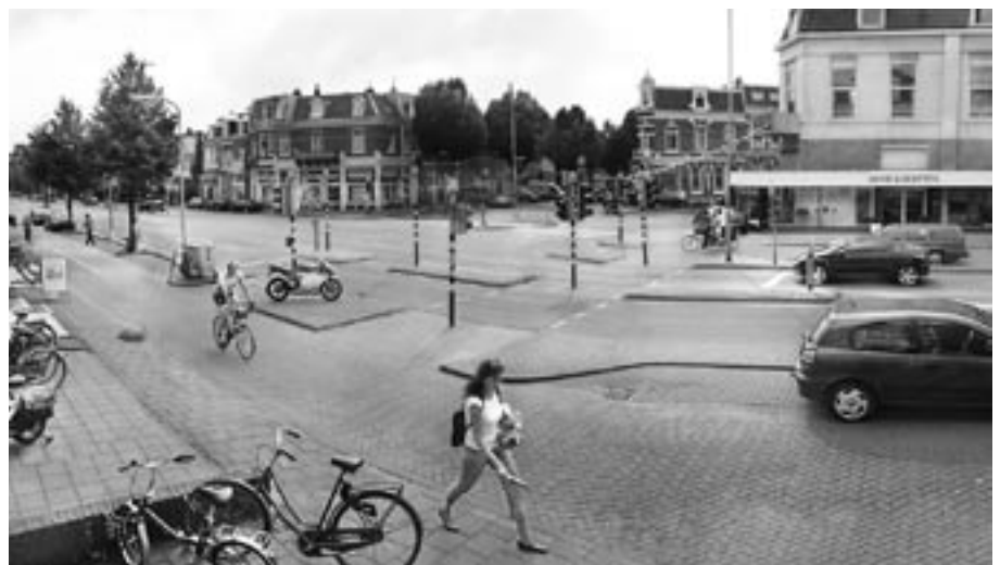
Het kruispunt St. Annastraat - Stijn Buysstraat - Van Goorstraat dat mogelijk wordt heringericht

En verder is de bewonersorganisatie achter de schermen druk bezig met ondermeer een alternatief voor de touringcaropstapplaats aan de Arend Noorduijnstraat, de komst van een pinautomaat in de wijk, het terugdringen van het aantal coffeeshops, het maken van een wijkvisie en een wijkveiligheidsplan, de plannen voor een parkeergarage onder de Van Schaeck Mathonsingel en nog veel meer. ■