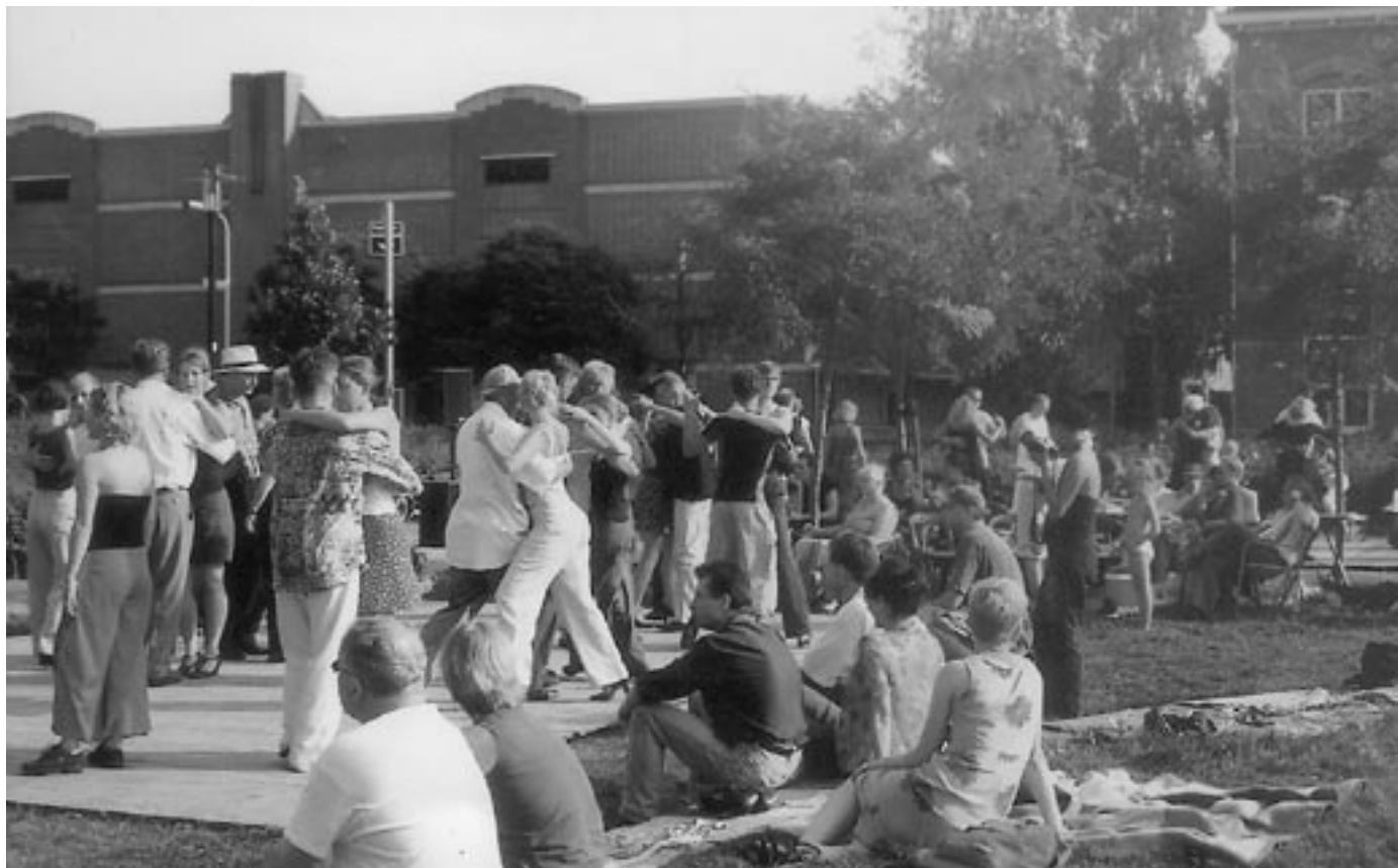
Tangodansen op het park