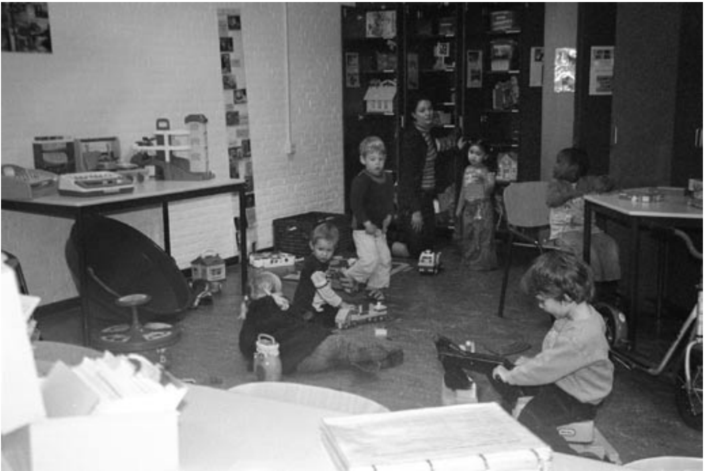
Alle foto's bij dit artikel: