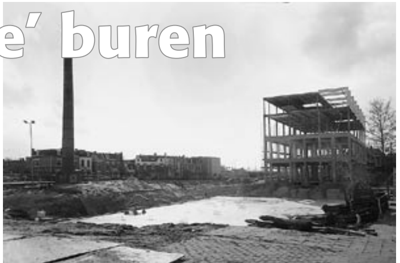
Het Dobbelmanterrein waar straks de 128 nieuwe woningen verschijnen.

Het kan niemand ontgaan zijn dat er op het Dobbelman terrein flink wordt gebouwd. Er komen 128 woningen en appartementen variërend van Bottendaalse herenhuisen met souterrain en trapje naar de voordeur tot kleine studio's. Wie gaan er eigenlijk wonen in die huizen? En waarom? De Zeeheld sprak met een aantal toekomstige bewoners om een indruk te krijgen en stuitte ook op iemand die niet kocht.