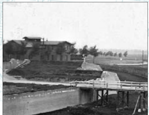
De enige bekende foto van het eerste Nijmeegsche station met alleen nog een verbinding naar Kleef. Te zien is de vesting bij het station aan de Molenpoort.