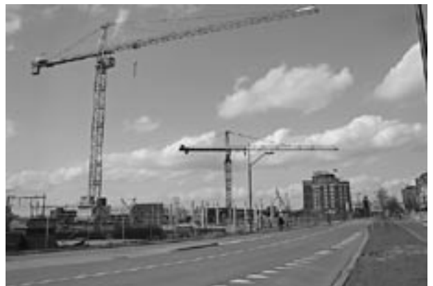
Het toekomstige ROC-gebouw bij het Mercure-hotel

steun te verwachten is voor het ontwikkelen van een wijkvisie. Daar kunnen alleen achterstandswijken aanspraak op maken. Wat de BOB betreft gaat de wijkvisie er ondanks deze tegenvaller gewoon komen.