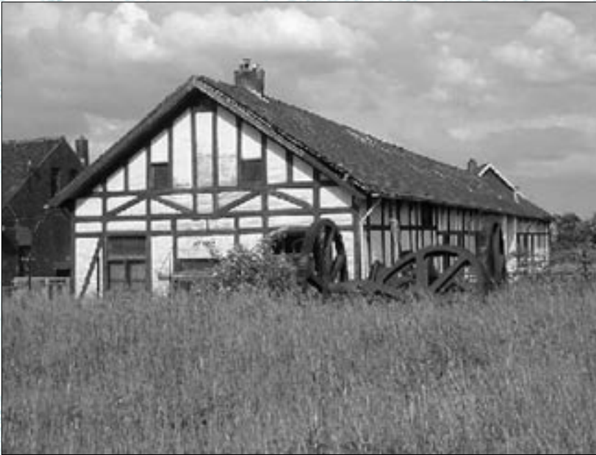
Het houten station is later verplaatst naar de Ooy